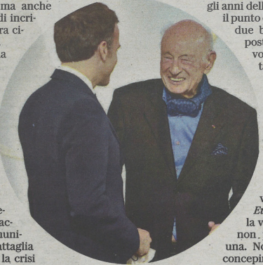
Luglio 2021: la stretta di mano all'Eliseo tra il presidente francese Emmanuel Macron (di spalle) e Edgar Morin, in occasione della festa per il compleanno del filosofo

Solo l'Europa ha la storia e il deposito culturale per tentare simile operazione. Certo oggi, sotto le scosse sismiche che percuotono il mondo, prosciugando le fonti del diritto internazionale, tutto ciò sembra fuori portata. Ma, a volte, quanto la volontà non riesce a volere, la necessità impone di fare: sottrarsi all'inevitabile, aprirsi all'imprevedibile. Esclusa dai tavoli che contano, abbandonata dall'alleato americano, accerchiata dai nuovi imperi, all'Europa non resta che imboccare la strada che Edgar Morin le ha più volte indicato: diventare il baricentro complesso di un nuovo ordine internazionale.