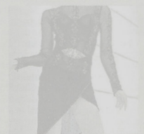
RUBATA Una delle cinture

Più che un furto qualsiasi, la sparizione di due cinture facenti parte dei corredi di scena di Raffaella Carrà, in mostra a San Benedetto del Tronto (Ascoli Piceno), appare come una vera e propria profanazione a danno della memoria di una icona della storia dello spettacolo italiano ed internazionale. Non c'è traccia delle due cinture sottratte durante la mostra "Rumore", terminata ieri alla Palazzina Azzurra, uno dei luoghi simbolo della cultura sambenedettese. Dal 18 aprile a domenica 10 maggio in tanti hanno ammirato i 30 abiti della Carrà, prendendo parte a laboratori e convegni in tema con lo spirito dell'esposizione ideata per raccontare la sfavillante