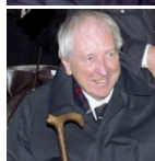
TOMAS TRANSTRÖMER Premio Internazionale Nonino 2004 Nobel per la Letteratura 2011