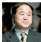
MO YAN Premio Internazionale Nonino 2005 Nobel per la Letteratura 2012