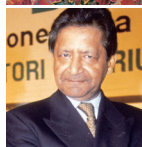
V.S. NAIPAUL Premio Internazionale Nonino 1993 Nobel per la Letteratura 2001