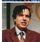
GIORGIO PARISI Premio Nonino a 'un Maestro del nostro Tempo' 2005 Nobel per la Fisica 2021