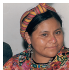
RIGOBERTA MENCHÚ Nonino Sonderpreis 1988 Friedensnobelpreis 1992