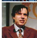
GIORGIO PARISI Nonino Preis “An einen Meister unserer Zeit” 2005 Nobelpreis für Physik 2021