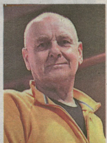
BENITO NONINO FONDATORE DELLA DINASTIA DEI DISTILLATORI FRIULANI

Krüger ha più di quaranta libri al suo attivo, spaziando tra poesie, racconti, romanzi, critica letteraria e traduzioni, tra cui quella delle poesie di Cesare Pavese. "Che cosa significa essere uno scrittore?" - si legge