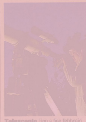
Telescopio Fino a fine febbraio

Sei pianeti visibili in un solo colpo d'occhio, dalla finestra di casa. È quanto si può fare in queste sere alzando lo sguardo al cielo per ammirare l'insolita sfilata inscenata da Venere, Saturno, Giove, Marte, Urano e Nettuno. La parata planetaria è una cosa ben diversa dall'allineamento di pianeti, andrà avanti per diverse settimane e a fine febbraio sarà completata da Mercurio. Meteo permettendo, lo spettacolo inizia alle ore 19: puntando gli occhi verso ovest «si riconosce subito la luminosissima Venere, l'astro notturno in assoluto