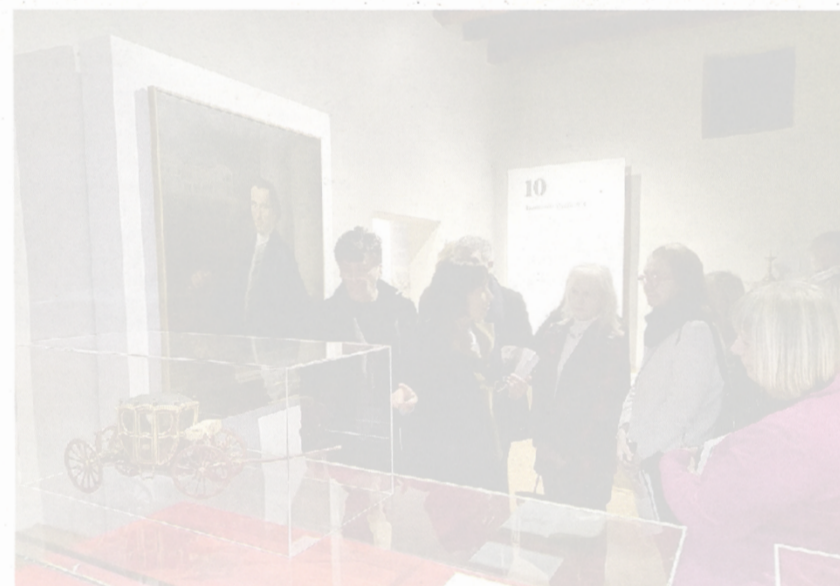
A sinistra il ritratto di Francesco Maria Preti in una delle sale della rassegna e sotto alcuni preziosi strumenti musicali del '700

La mostra ruota quindi non solo attorno alla figura di Preti, uno dei più importanti architetti del Settecento, che ha rivoluzionato