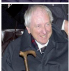
TOMAS TRANSTRÖMER Premio Internazionale Nonino 2004 Nobel per la Letteratura 2011