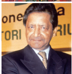
V.S. NAIPAUL Premio Internazionale Nonino 1993 Nobel per la Letteratura 2001