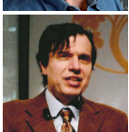
GIORGIO PARISI Premio Nonino a 'un Maestro del nostro Tempo' 2005 Nobel per la Fisica 2021

Nel 1973 Giannola e Benito Nonino rivoluzionano il sistema di produrre e presentare la Grappa in Italia e nel mondo: creano il Monovitigno® Nonino, distillando separatamente le vinacce dell'Uva Picolit.