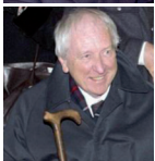
TOMAS TRANSTRÖMER Internationaler Nonino Preis 2004 Nobelpreis für Literatur 2011