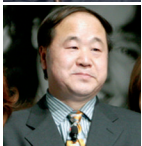
MO YAN Internationaler Nonino Preis 2005 Nobelpreis für Literatur 2012