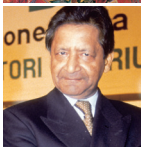
V.S. NAIPAUL Internationaler Nonino Preis 1993 Nobelpreis für Literatur 2001