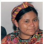
RIGOBERTA MENCHÙ Nonino Sonderpreis 1988 Friedensnobelpreis 1992