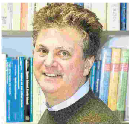
L'archeologo Inglese Cyprian Broodbank