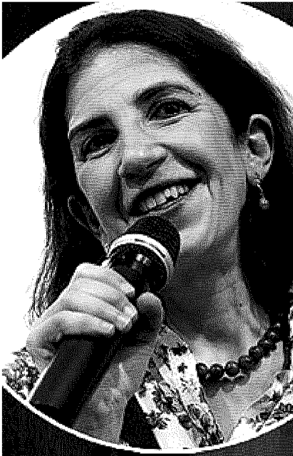
Il bosone di Higgs; sopra la professoressa Fabiola Gianotti, sotto il professore scozzese