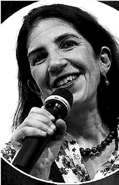
Il bosone di Higgs; sopra la professoressa Fabiola Gianotti, sotto il professore scozzese