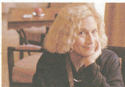
STUDIOSA La filosofa Martha Nussbaum