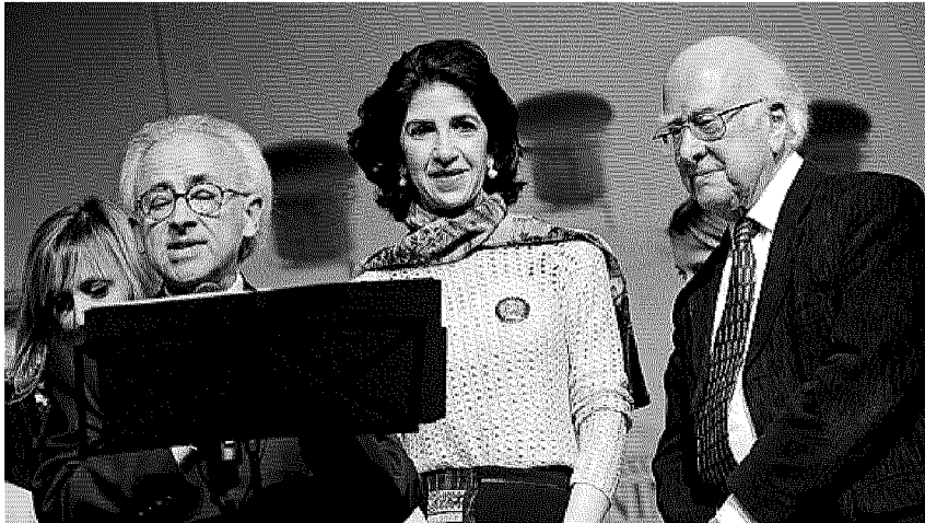
I fisici Fabiola Gianotti, responsabile del progetto Atlas, e Peter Higgs, pioniere del bosone (a destra), premiati a Ronchi di Percoto da Antonio R. Damasio