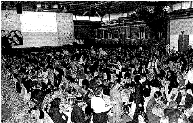
Una veduta della sala affollatissima a Ronchi di Percoto

natura. E tale rapporto, antico e cruciale, assume un valore particolare in una fase in cui la catena alimentare risulta così lunga e opaca che molti sono giunti a pensare che il vino sia prodotto dalle enoteche, le olive dai supermercati, gli hamburger da McDonald's. Il sistema della globalizzazione e dell'industrializzazione ci porta a considerare il cibo un semplice prodotto, non dissimile da tutti gli altri, e non quello che realmente è: una serie, appunto, di relazioni». (I.a.)