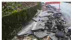
Allagamenti, frane e disagi: attivato il servizio di piena del Tagliamento