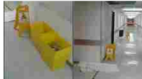
Un po' di pioggia e l'ospedale si allaga: disagi ed emergenza nelle corsie