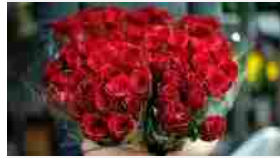
«Per te tanti fiori, nonna cara»: col mazzo di rose le rubano 3mila euro