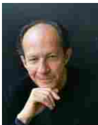
Giorgio Agamben (Roma, 1942)

responsabili del progetto benefico internazionale P(our), nella rosa dei tre riconoscimenti assegnati quest'anno dal Premio Nonino .