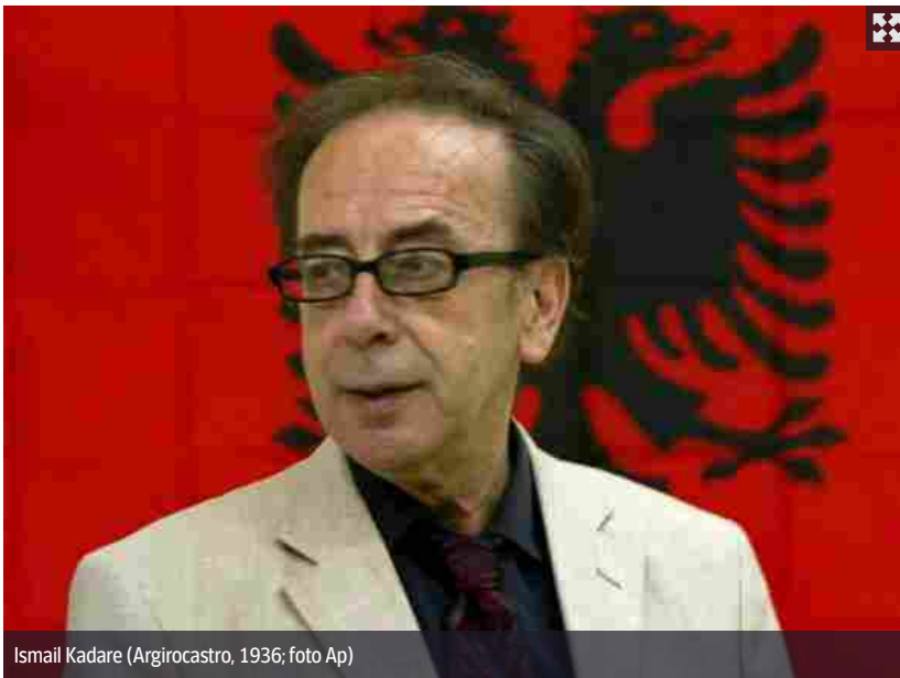
Ismail Kadare (Argirocastro, 1936)

Oltre al romanziere-poeta albanese Ismail Kadare, al filosofo veneziano Giorgio Agamben, c'è una «salsa millenaria» prodotta dalle tribù indigene della Foresta pluviale dell'Amazzonia, rilanciata ora dall'azione dei